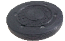
145.0134 Selo 57,2x52,2x10,6