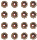
125.0108 Retentor Válvulas (VI)(764026)