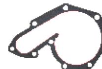
15.41.76 Junta Bomba D'Agua (PV)