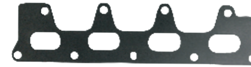
14.20.108 Junta Coletor Escapamento(MP)